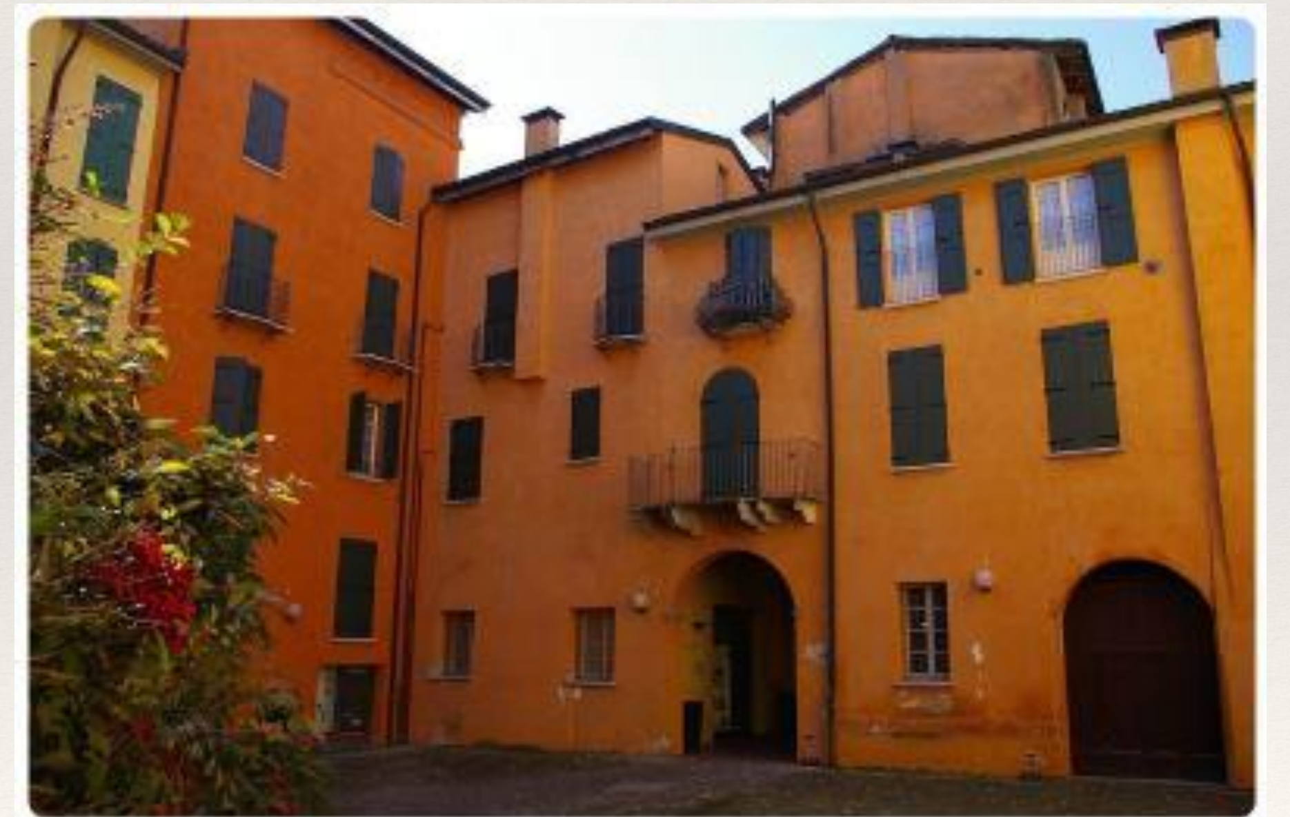
Ghetto di Cento