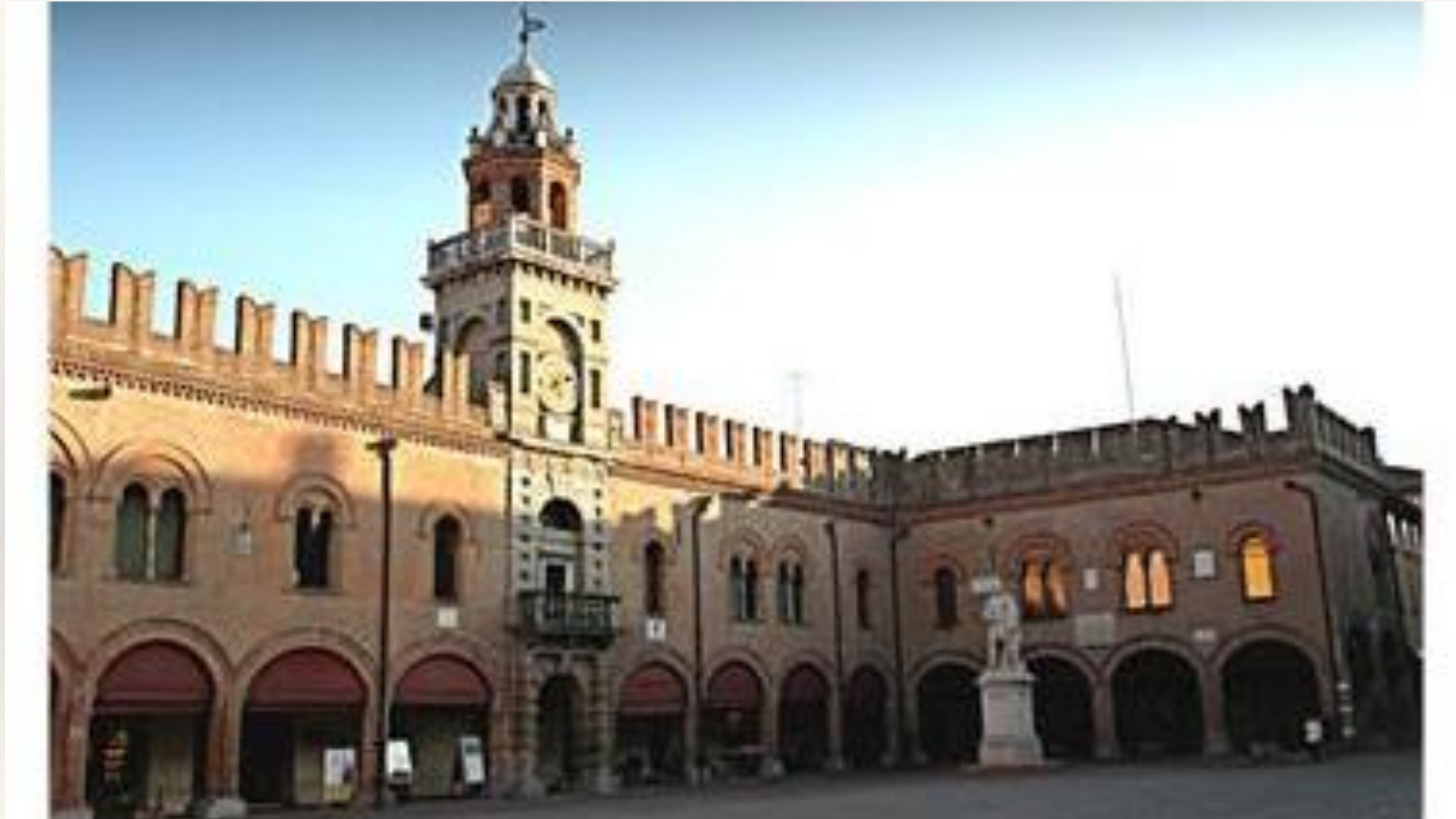
Palazzo del Governatore 7