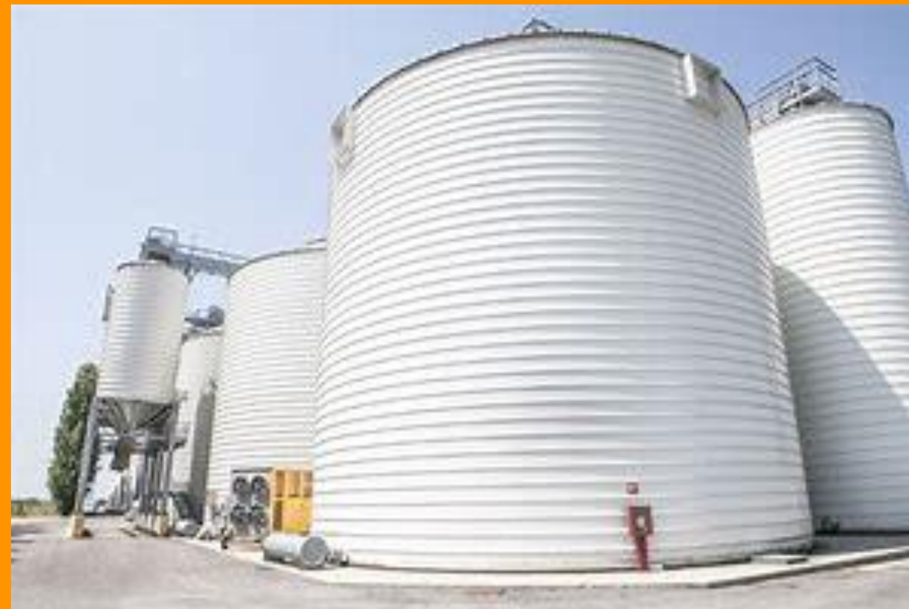
Molini Pivetti Renazzo