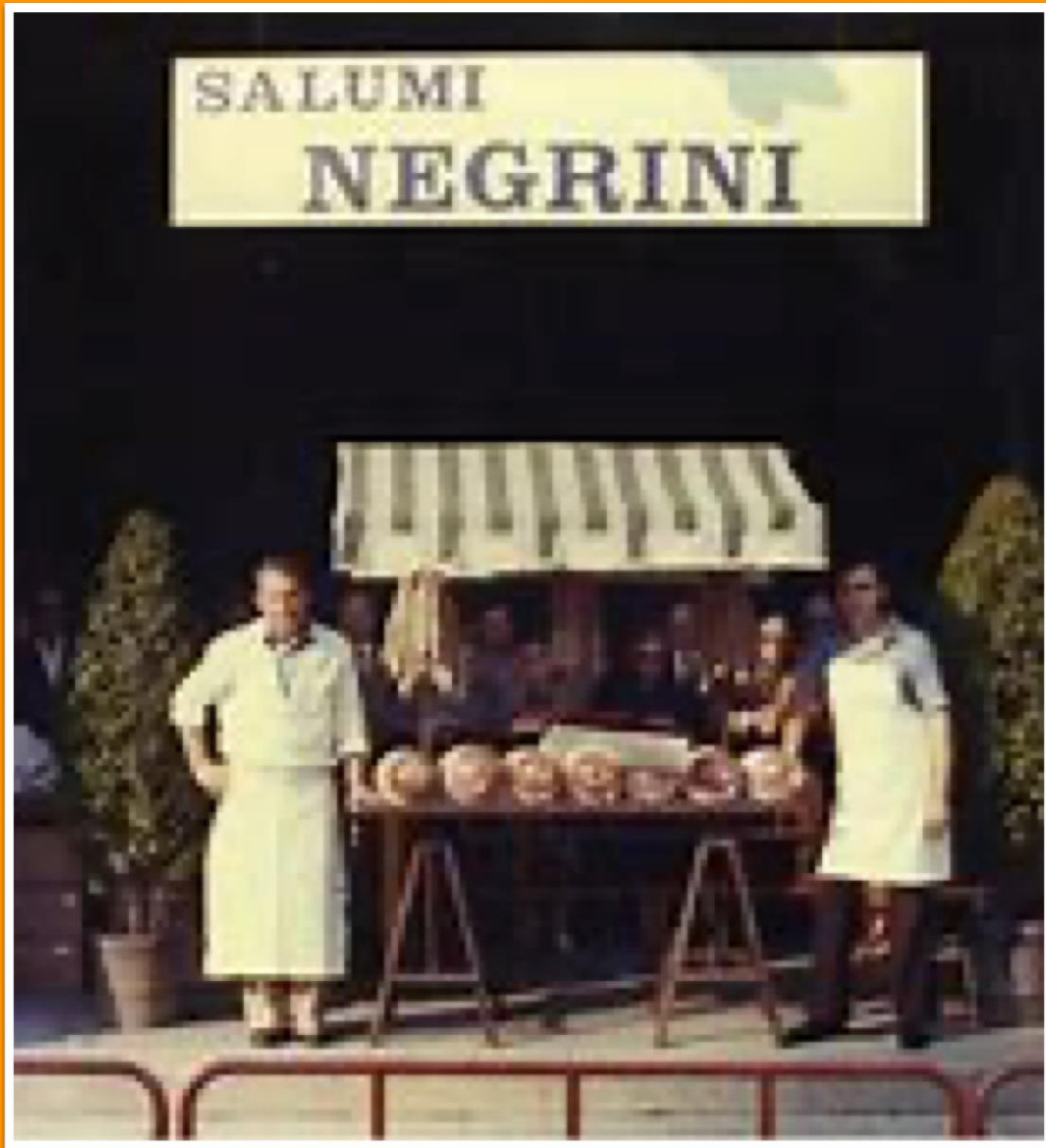
Salumificio Negrini, Renazzo