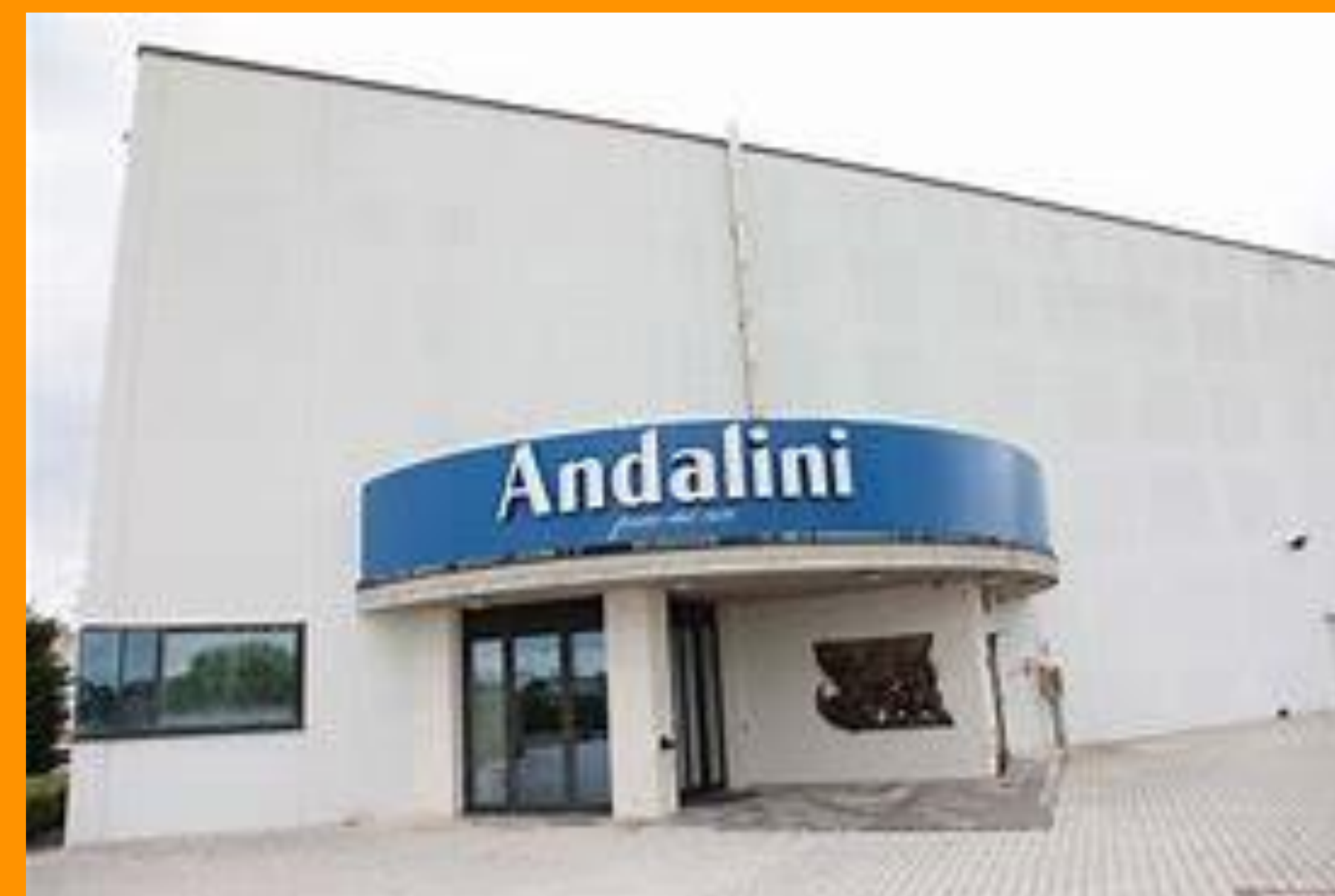
Pastificio Andalini Cento