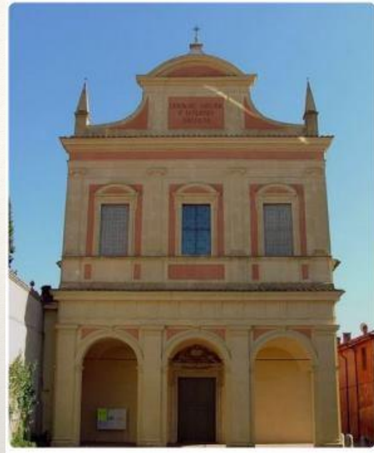
Chiesa de Rosario